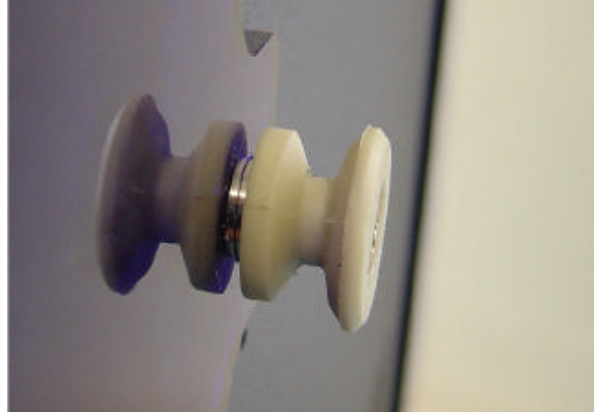
Bild 7 Die Abstandshülsen sollen verhindern, dass das Plexiglas unter Spannung verschraubt wird und dann bei Wärmeausdehnung bricht.