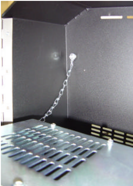
Bild 8 Fixieren Sie im Geräteinneren links oben die Fangkette des PC Gehäuses.